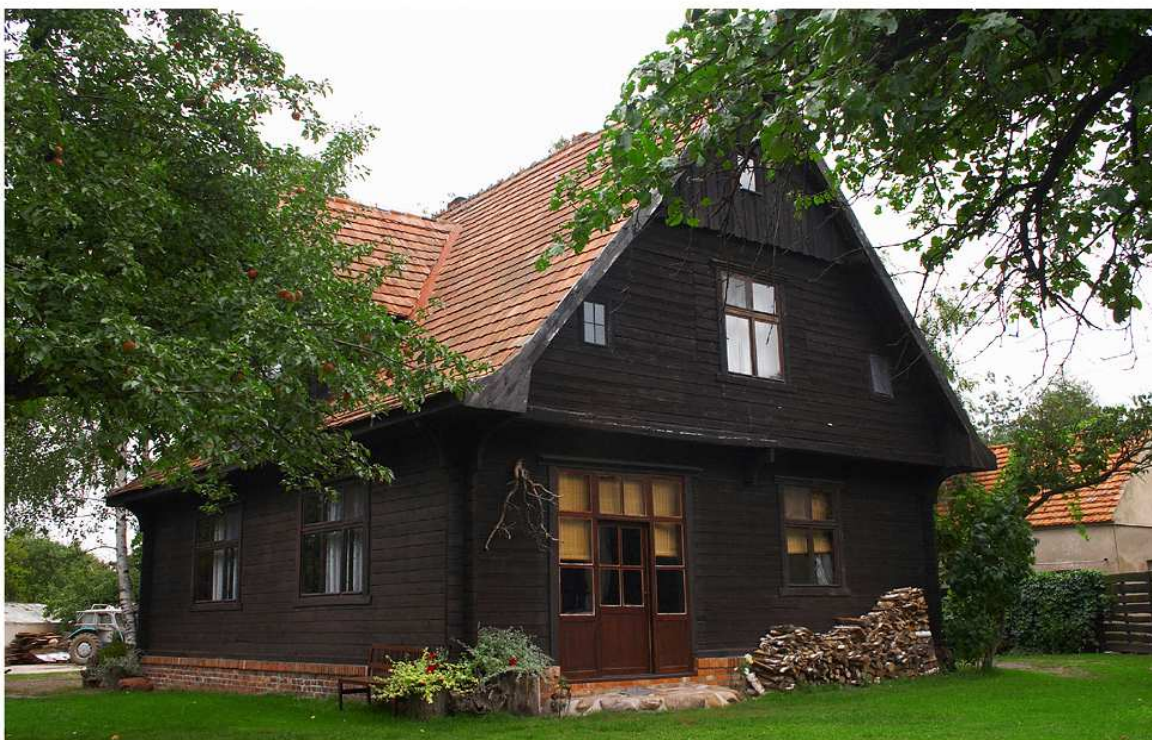
Rys. 3 „Chata na skraju”

We wsi swą działalność prowadzi Ochotnicza Straż Pożarna, która powstała w 1935 roku. Aktywnie działają drużyny młodzieżowe- męskie/ żeńskie. Strażacy OSP Nowy Belęcin biorą udział w szkoleniach i zawodach gminnych i powiatowych. Także kobiety z miejscowości aktywnie uczestniczą w życiu wsi poprzez Koło Gospodyń Wiejskich. Na terenie Nowego Belęcina znajduje się także gospodarstwo agroturystyczne „Chata na skraju”.