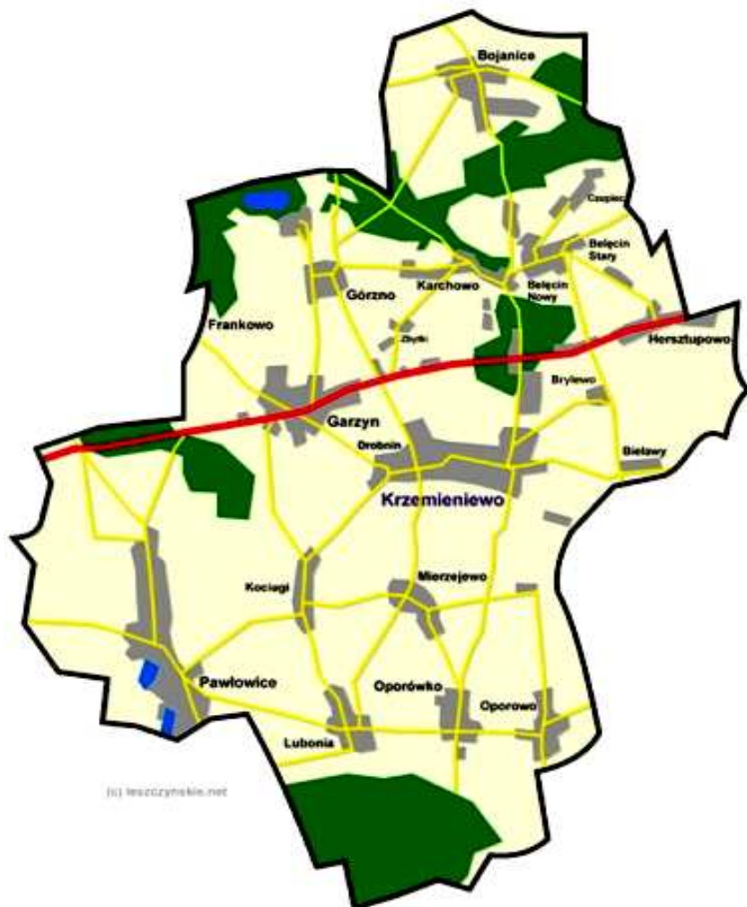
Rys. 1 Mapa Gminy Krzemieniewo

Warszawa: 335,1 km, czas przejazdu 4 h 33 min, średnia prędkość 74 km/h