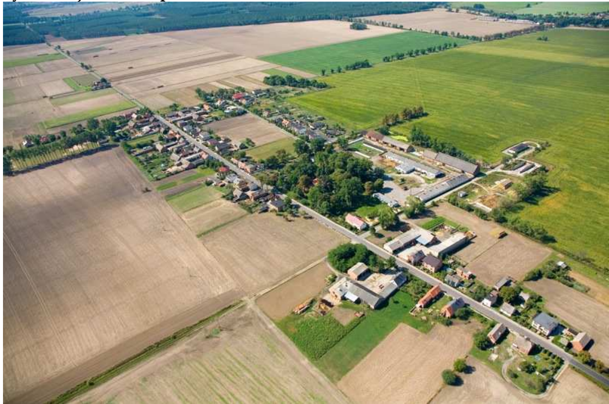
Rys. 2 Miejscowość Oporówko