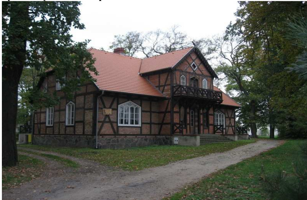
Rys. 3 Rządówka w Oporówku

BUDYNEK MIESZKALNO-ADMINISTRACYJNY z 3 ćwierci XIX wieku, murowany, otynkowany, jednokondygnacyjny, w bryle czytelne dwie części, południowa z nich wyższa (podpiwniczona), kryte osobnymi dachami dwuspadowymi. Na rzucie prostokąta, z dwiema sieniami, układ dwutraktowy. Elewacje przeprute prostokątnymi otworami, opięte na narożach rodzajem wieżyczek.