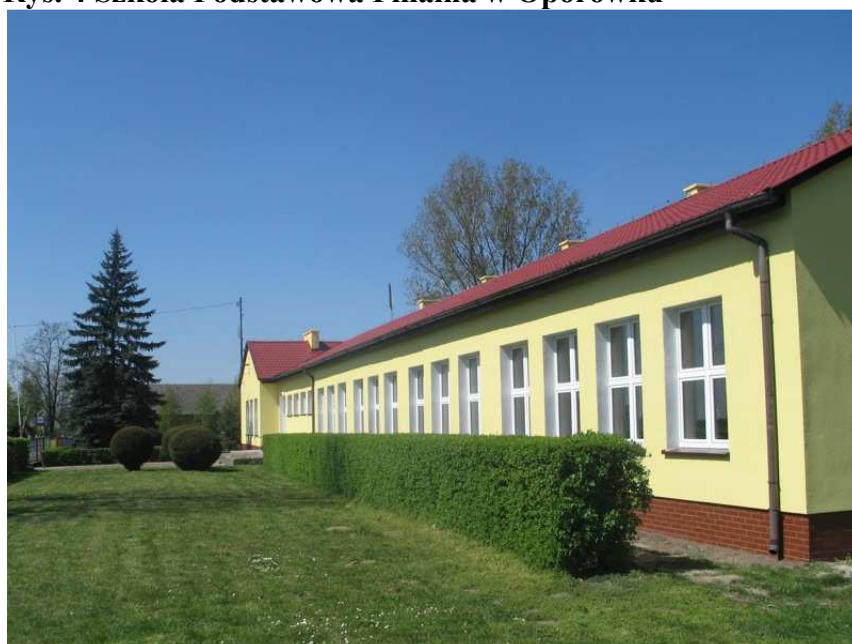
Rys. 4 Szkoła Podstawowa Filialna w Oporówku