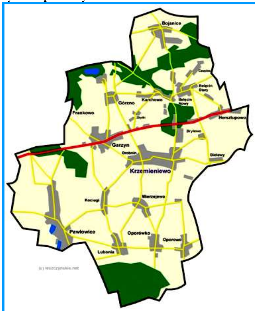
Rys. 1 Mapa Gminy Krzemieniewo

Oporówko położone jest w województwie wielkopolskim, powiecie leszczyńskim, na terenie gminy Krzemieniewo, na wschód od miasta Leszna. Jest jednym z 18 sołectw gminy Krzemieniewo. Wieś graniczy administracyjnie z następującymi miejscowościami: Lubonia, Oporowo, Mierzejewo, Śmiłowo,